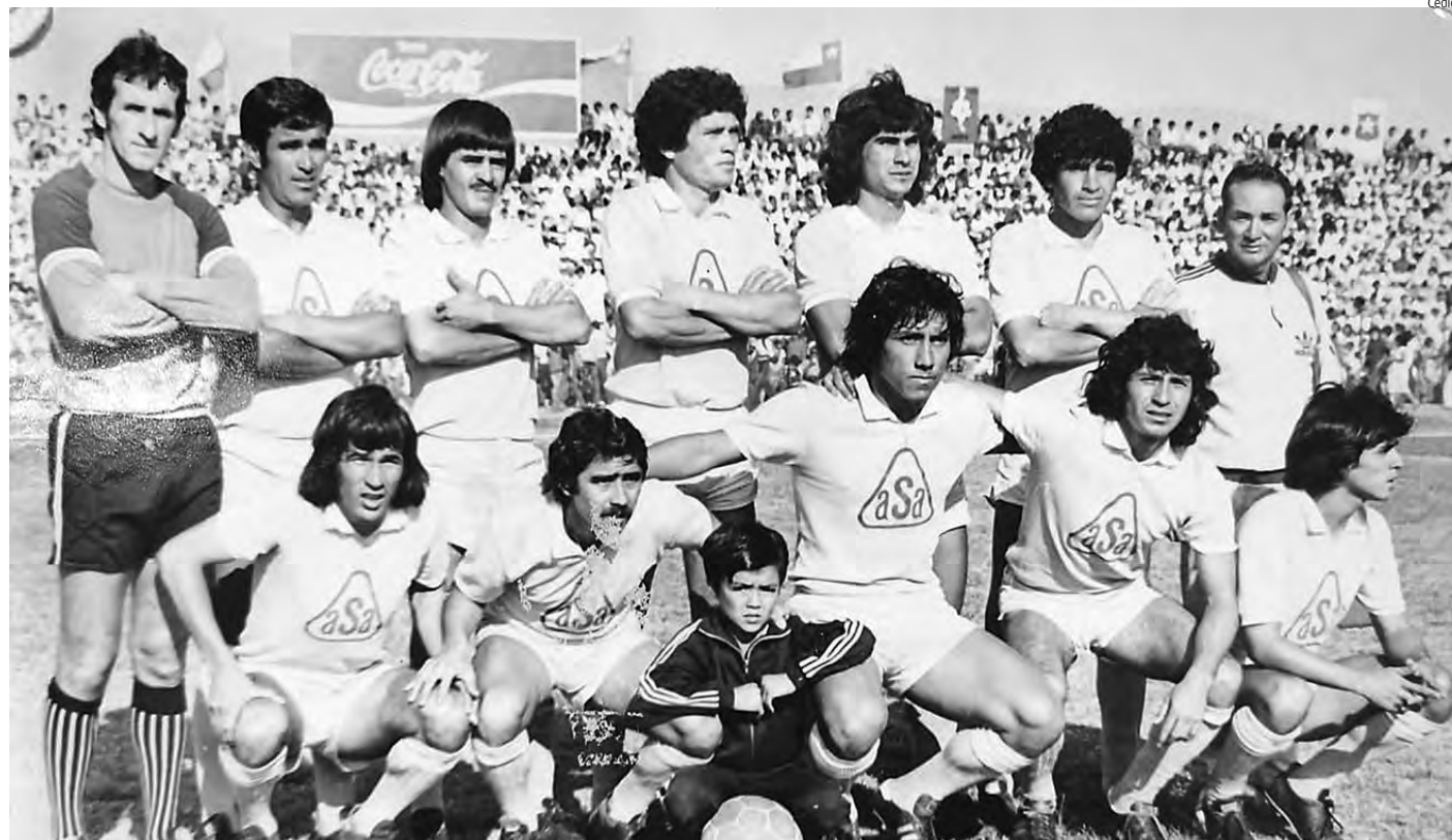
DEPORTES IQUIQUE DESDE SUS ORÍGENES PRESENTA EQUIPOS CON GARRA EN LOS TORNEOS DEL FÚTBOL PROFESIONAL.

El resto de la década de 1980 fue de dulce y agraz, pero sin embargo destacó la temporada del peruano Juan José Oré en 1988 cuando fue máximo anotador del torneo de pri-