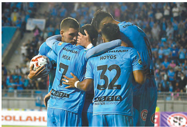
UN ABRAZO QUE SIMBOLIZÓ LA UNIÓN DEL EQUIPO.