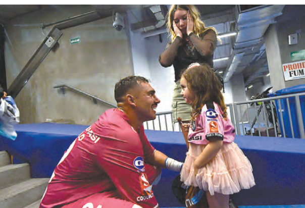
LA FELICITACIÓN MÁS ESPERADA DEL PORTERO IQUIQUEÑO.