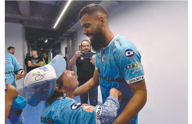
NADIE QUEDÓ ESE DÍA AJENO A LOS FESTEJOS.