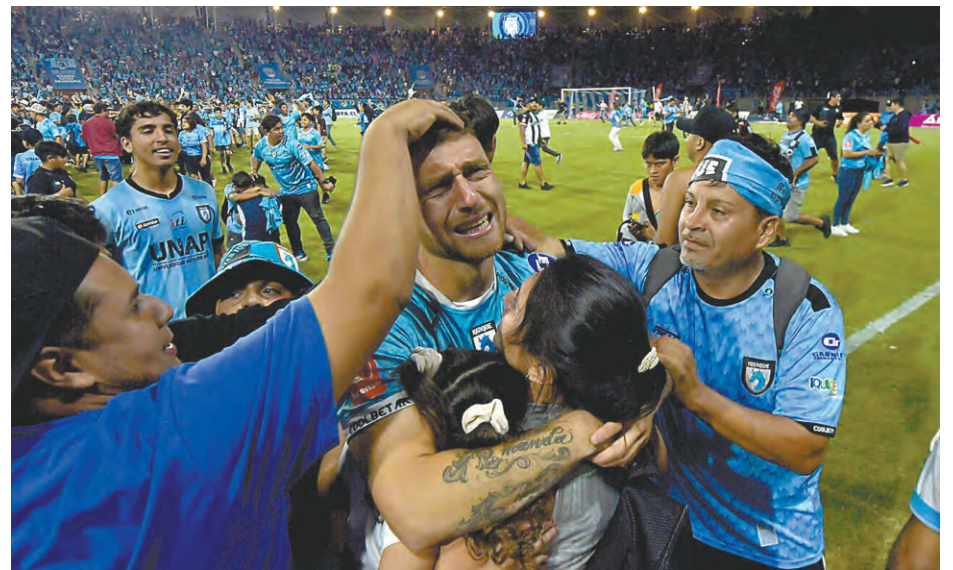
LA EMOCIÓN DE LOS JUGADORES E HINCHAS AL TÉRMINO DEL ENCUENTRO.