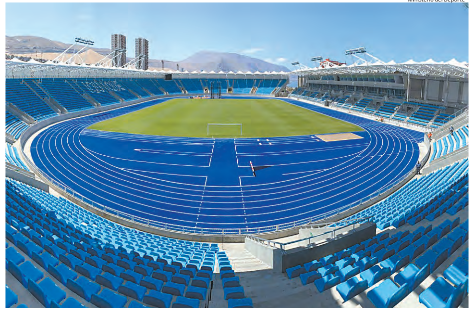
UNA IMPONENTE IMAGEN DEL ESTADIO 'TIERRA DE CAMPEONES'.

Estos dos recintos son parte del camino de Club Deportes Iquique en sus 46 años.