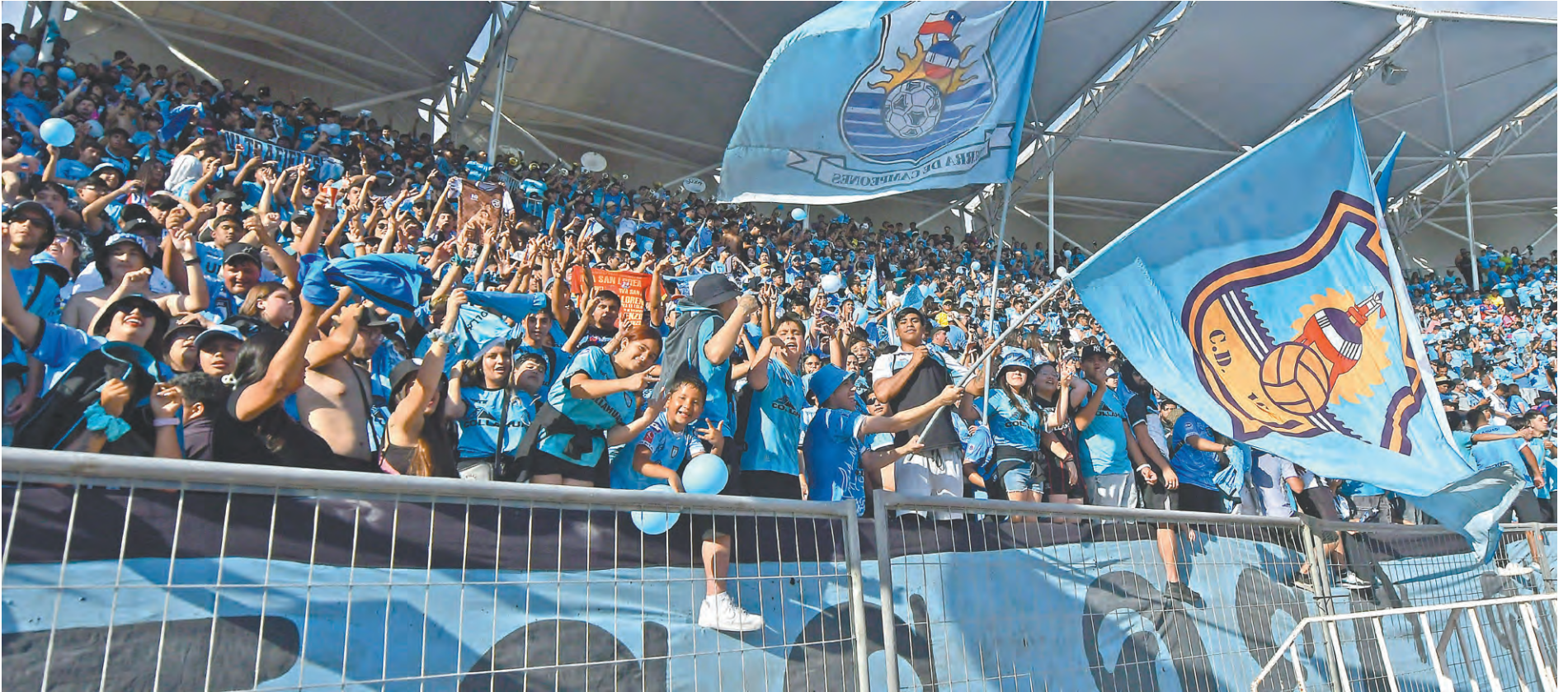
DESDE EL INICIO DEL PARTIDO, LA HINCHADA DESATÓ UN CARNAVAL EN EL ESTADIO 'TIERRA DE CAMPEONES'.